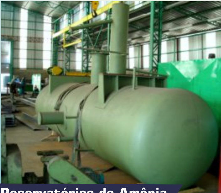
Reservatórios de Amônia