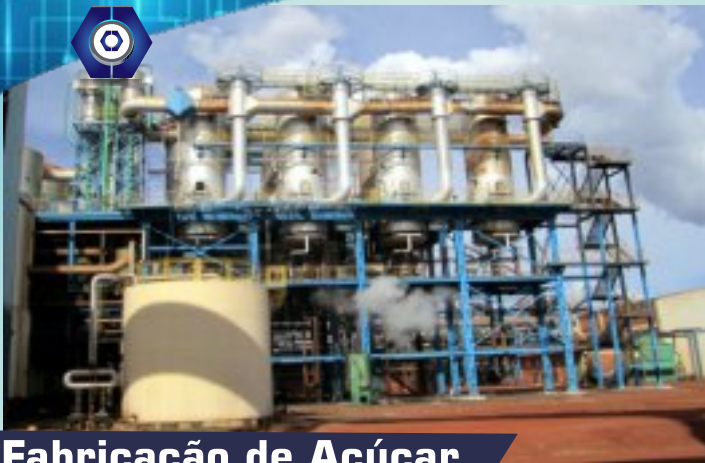
Fabricação de Açúcar