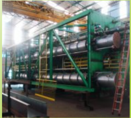
Fábrica 1 - Usinagem