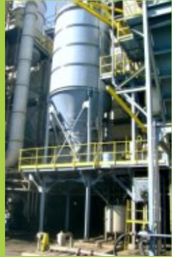
Silos de Cal