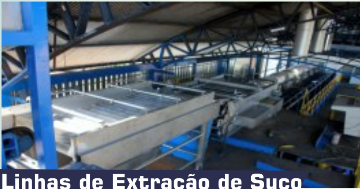
Linhas de Extração de Suco