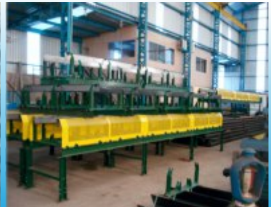
Fábrica 2 - Caldeiraria Aço Carbono com Jato e Pintura