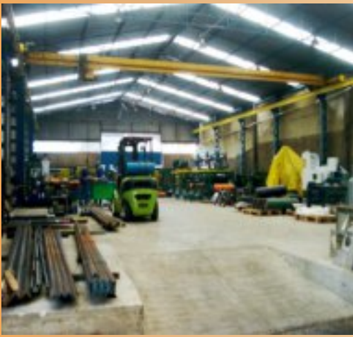
Fábrica 3 - Aço Inox